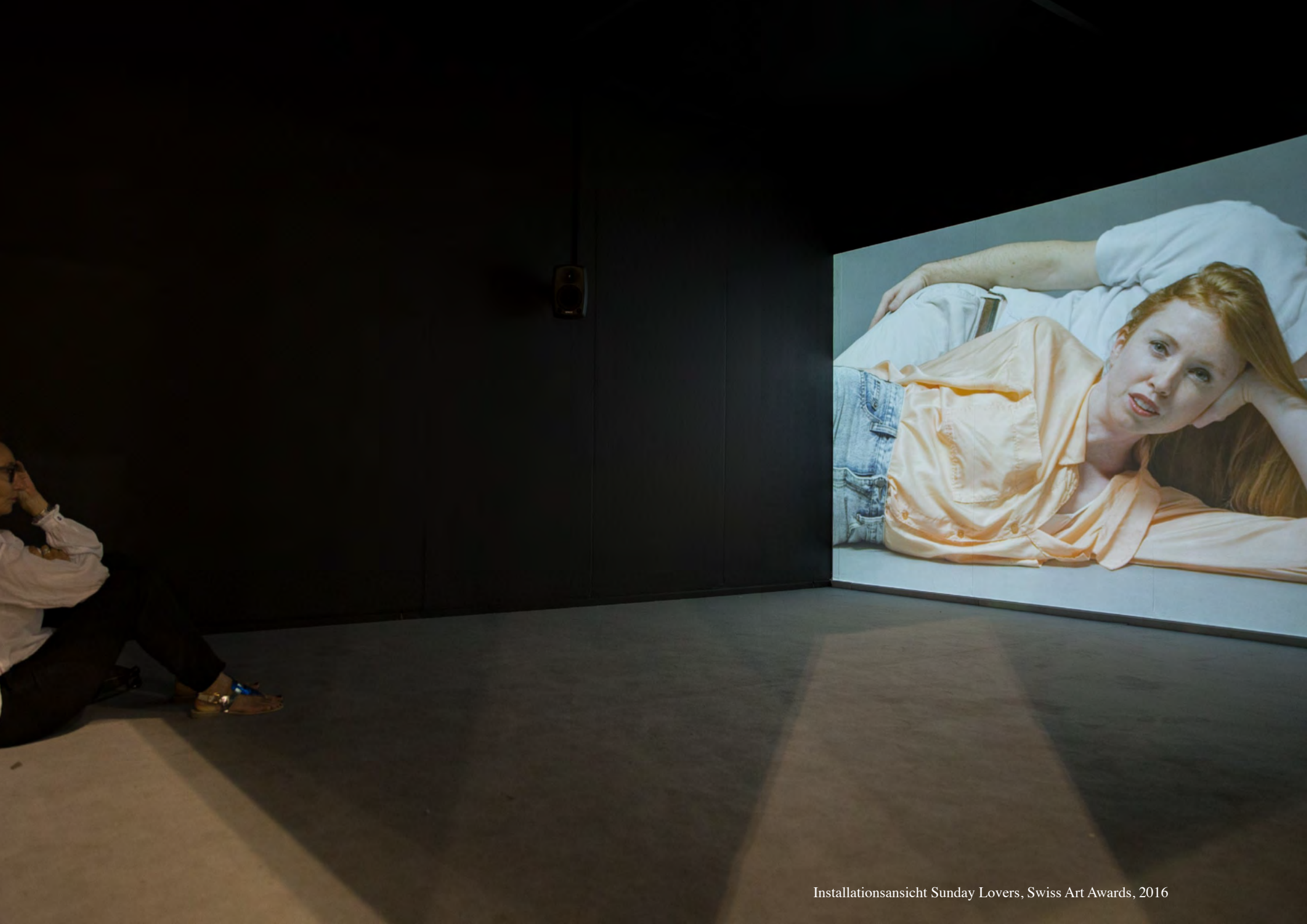
Installationsansicht Sunday Lovers, Swiss Art Awards, 2016